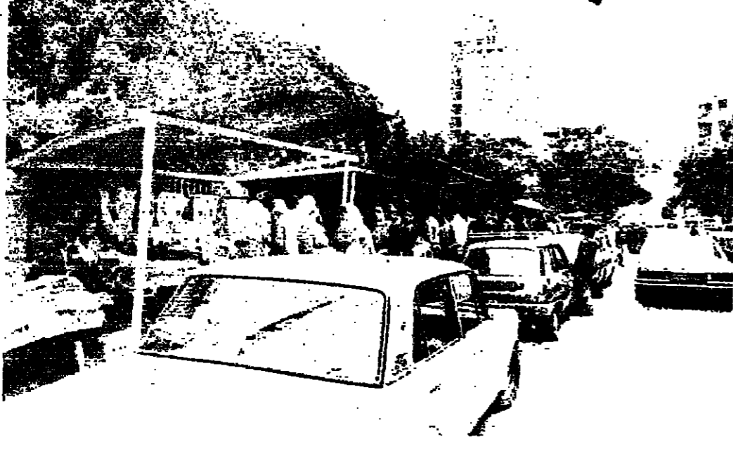
سقالات تنتصب في السوق الشعبية